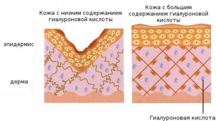
2-рис. Содержание влаги в коже

Недавний прогресс в деталях метаболизма ГК также прояснил давно оцененные наблюдения о том, что хроническое воспаление и солнечное повреждение, вызванное УФ-излучением, вызывают преждевременное старение кожи. Эти процессы, а также нормальное старение используют сходные механизмы, вызывающие потерю влаги и изменения в распределении ГК.